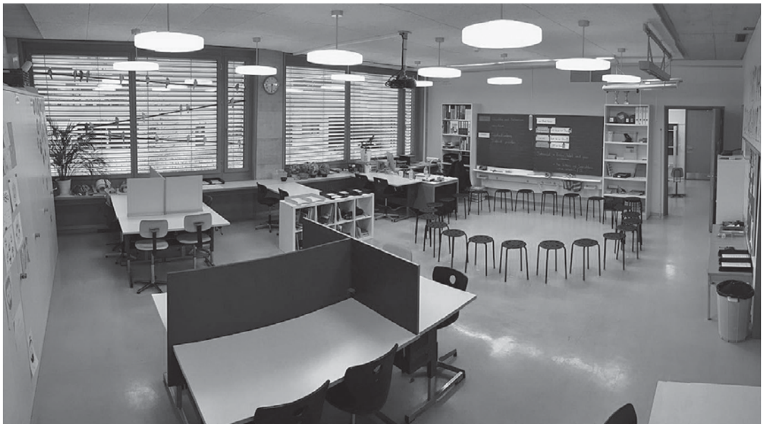
Abbildung 1: Schulzimmereinrichtung (Thöny, 2016)

Der Unterricht gewinnt im Kontext schulischer Inklusion als zentraler Ort der Veränderung zunehmend an Bedeutung. Dabei